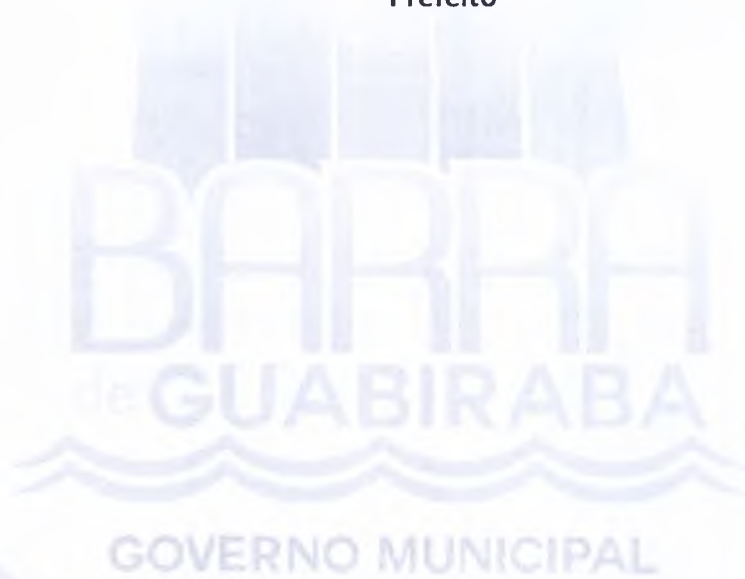
Antonio Carlos Lopes da Silva Prefeito

Gabinete do Prefeito, 03 de Setembro de 2013.